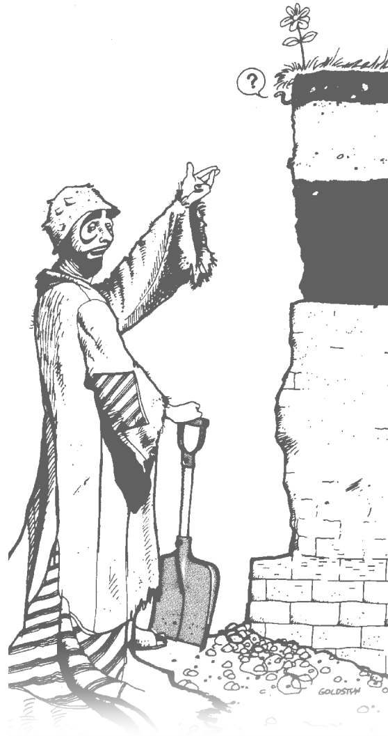
Caricature de Jacques Goldstyn du cahier scientifique n° 37 de l'ACFAS intitulé Rétrospective de la recherche sur les sols au Québec (1986)

C'est ainsi que plus de 600 types de sols couvrant plus de huit millions d'hectares ont été désignés à ce jour au Québec par une appellation liée à la situation géographique de leur première identification.