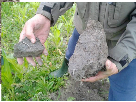
Les diagnostics sont parfois évidents, surtout lorsqu'on constate de tels symptômes de compaction.

est requis de creuser des profils allant jusqu'à 80 à 90 cm. Tel un livre ouvert, le profil permet de « lire » l'état physique du sol : si un champ offre un mauvais rendement, ce sera possiblement à cause de mauvaises conditions physiques. Structures, couleurs, densités, textures, aération, état hydrique et même odeurs