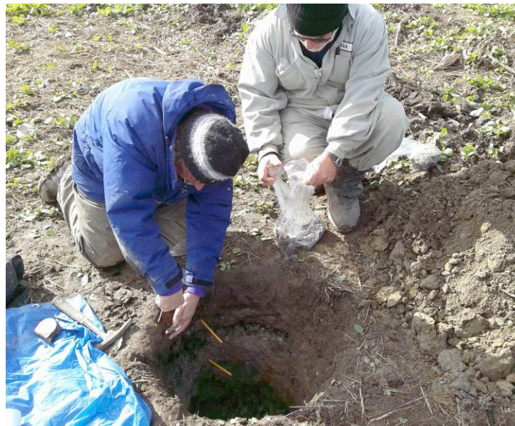
Le profil permet de « lire » l'état physique du sol, ce qui aide à diagnostiquer les causes des baisses de rendement.

Il est important que le producteur participe à l'évaluation de l'état de ses sols, notamment lors des investigations terrain de son agronome. Ensemble, ils examineront les pourtours du champ, évalueront la capacité de drainage de surface, noteront ou non des marques d'érosion et des risques de battance pour ensuite réaliser des profils de sols à des endroits stratégiques, dans chaque champ à évaluer. Dans les zones affectées, en comparaison avec les zones moins touchées, il